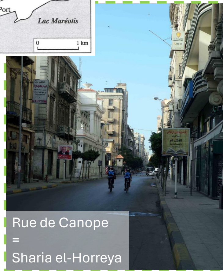
Rue de Canope = Sharia el-Horreya