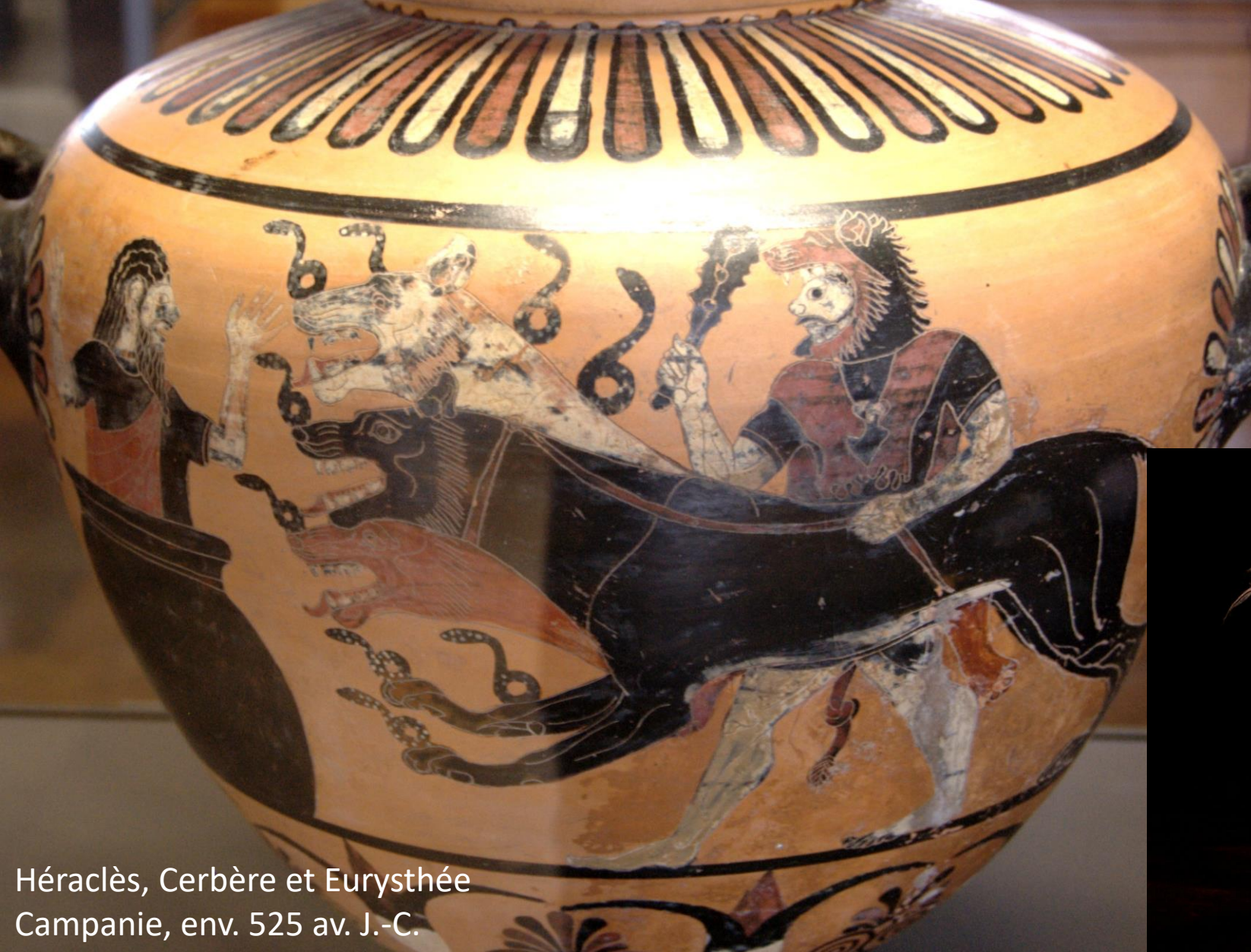
Héraclès, Cerbère et Eurysthée Campanie, env. 525 av. J.-C.