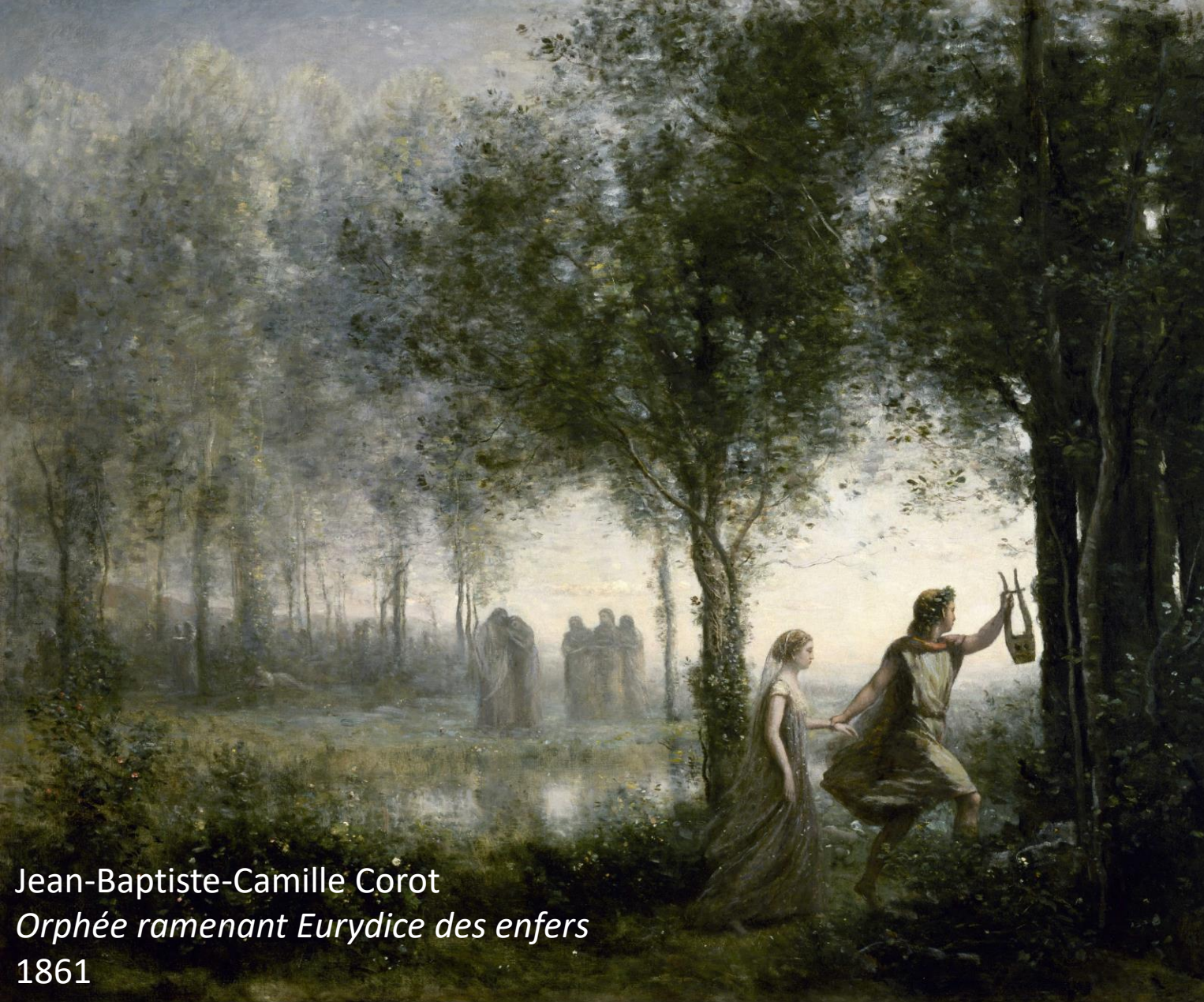
Jean-Baptiste-Camille Corot Orphée ramenant Eurydice des enfers 1861