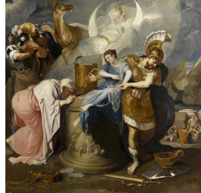
Bertholet Flémal Le sacrifice d'Iphigénie env. 1646