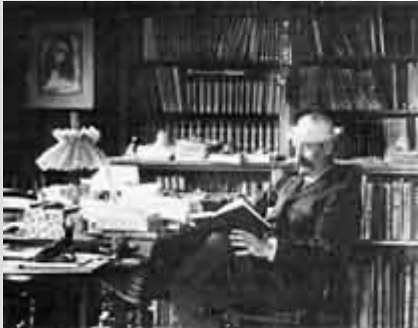
Dans son bureau...