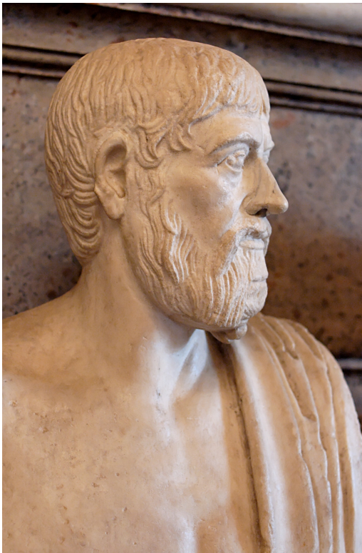
Pindare, reproduction de l'époque romaine d'après un original grec du V e siècle av. J.-C. Rom, Musei Capitolini, MC 586