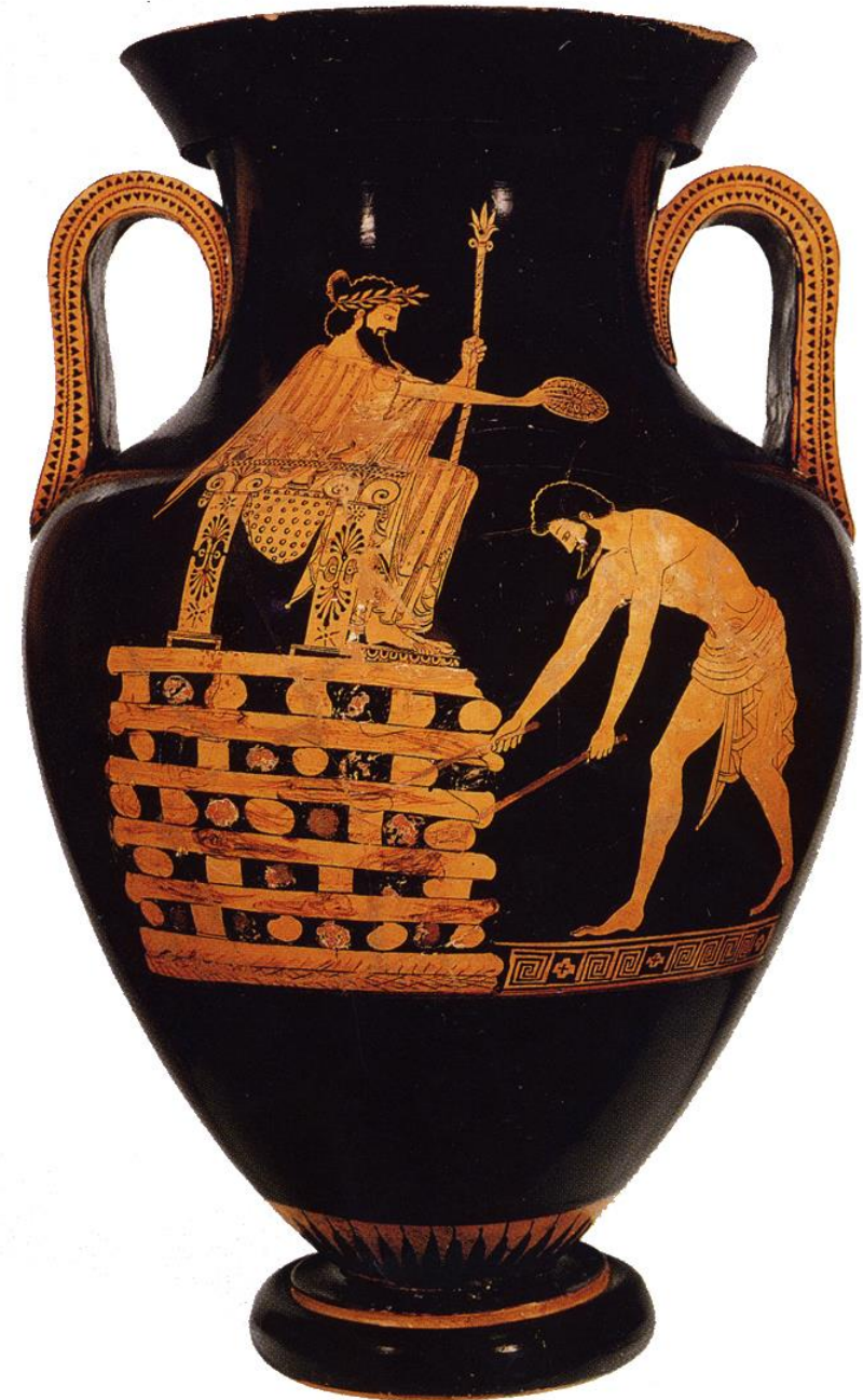
Crésus, roi de Lydie, sur son bûcher