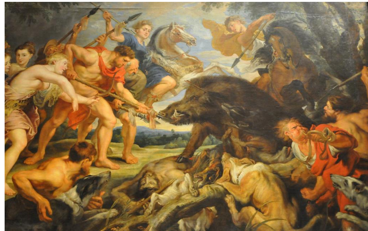
Peter Paul Rubens La chasse au sanglier de Calydon 1628