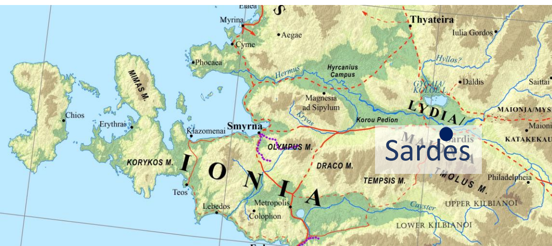
Bacchylide, Épinicie 3.10-26