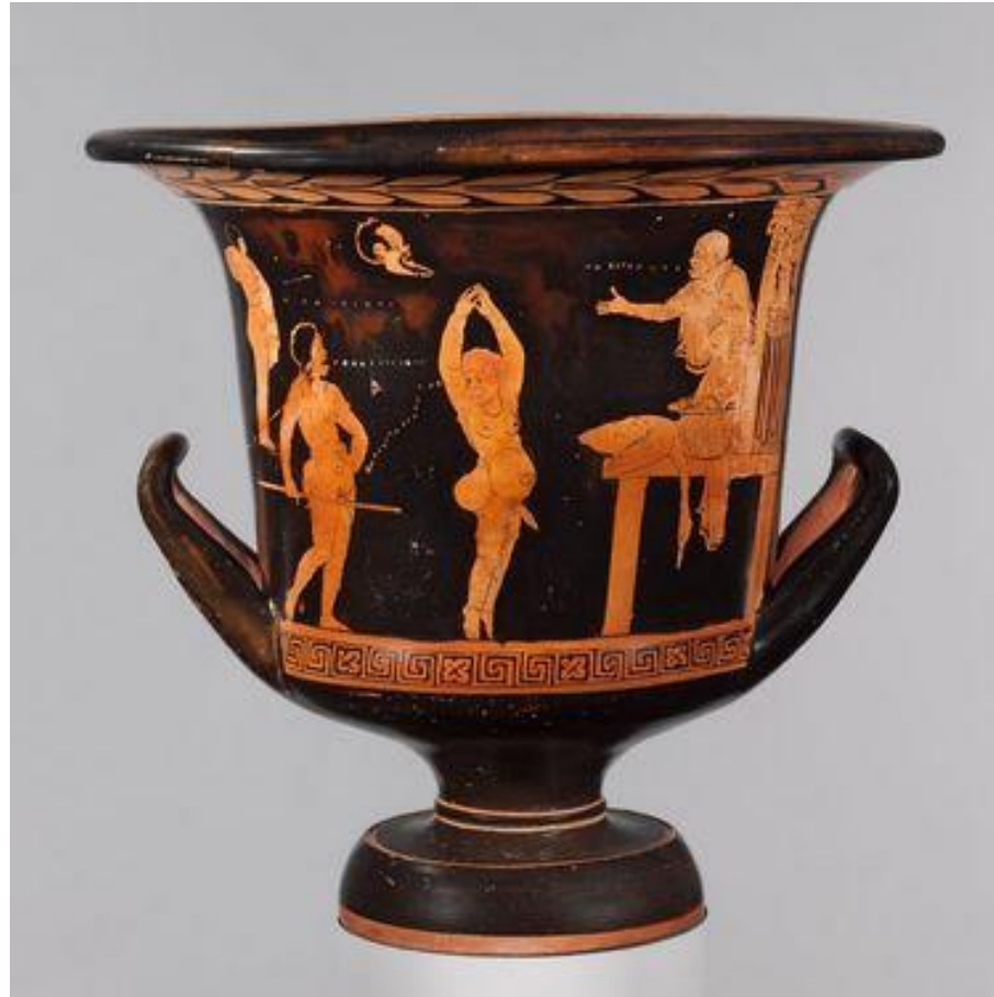
Cratère en calice apulien à figures rouges, New York, MMA, 24.97.104, c. 400 av. J.-C.