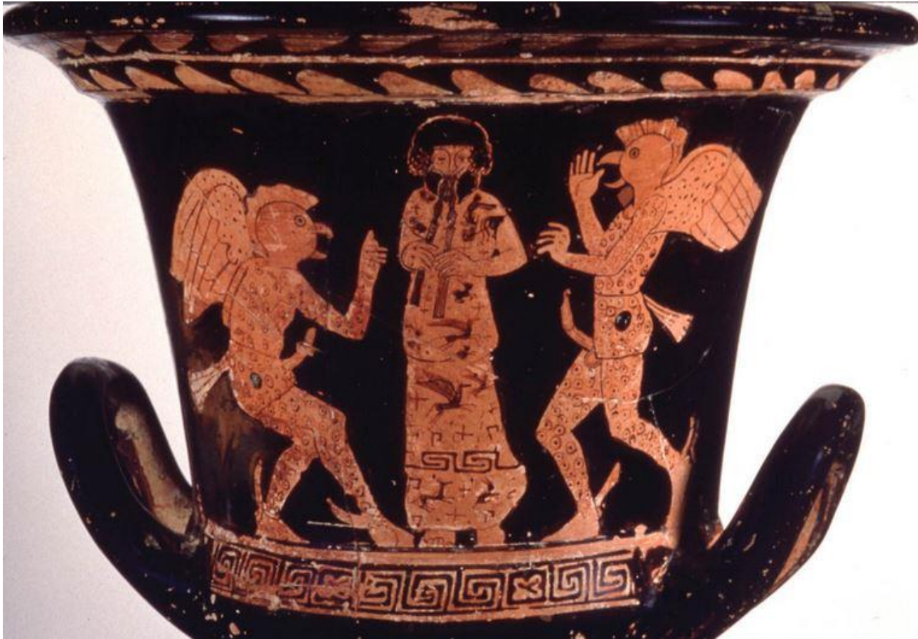
Cratère en calice attique à figures rouges, Getty Museum, Malibu 82.AE.83, c. 414 av. J.-C.