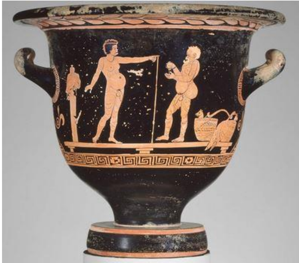
Cratère en cloche apulien à figures rouges, Boston, MFA, 69.695, c. 390 av. J.-C.